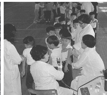
▲インフルエンザ予防注射