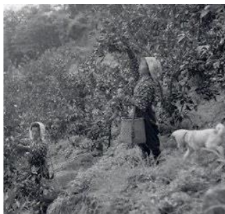
▲西田のみかん（三方町遊子）